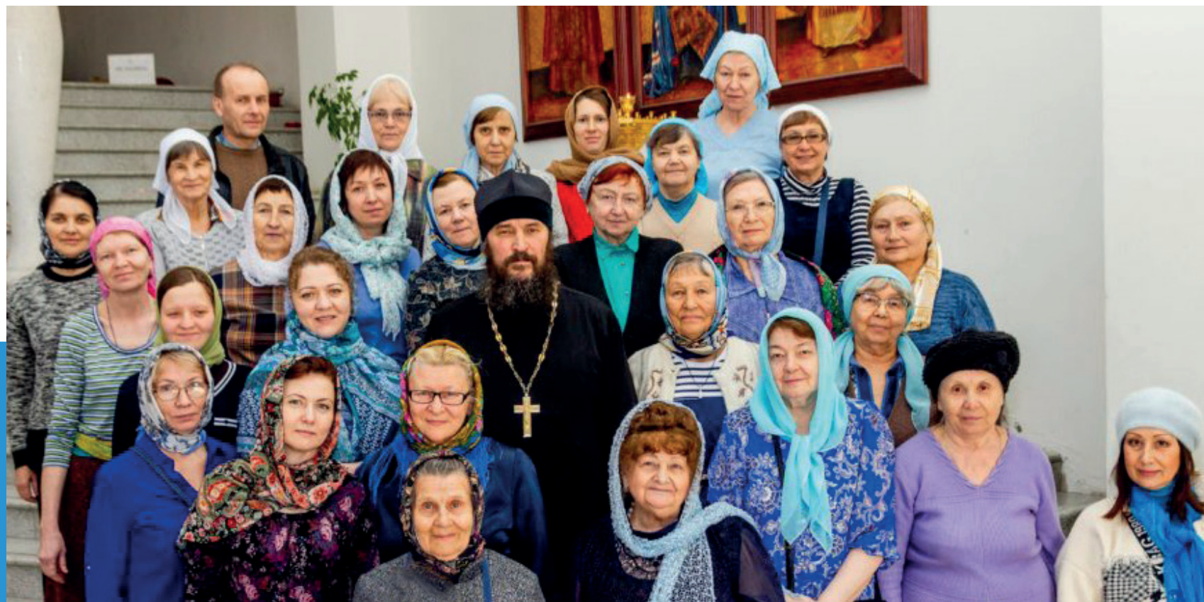
◀ Волонеры: Сестричество Михаило-Архангельского Харлампиевского храма